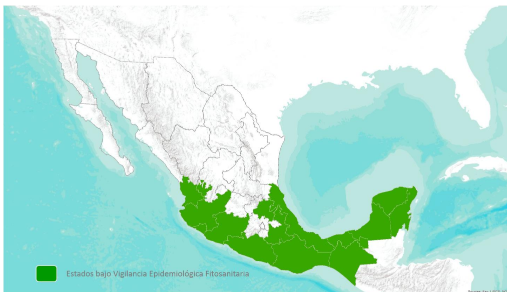
Figura 2. Vigilancia Epidemiológica Fitosanitaria para Fusarium oxysporum f. sp. cupense raza 4 Tropical. Elaboración propia con datos de DGSV-SENASICA-PVEF, 2016b.

exploración de 25,900 hectáreas, revisión periódica de 1,245 parcelas centinela y 688 rutas de vigilancia en áreas comerciales y zonas identificadas como de mayor riesgo. En el presente año, las acciones para la vigilancia de esta plaga se llevan a cabo en los estados de Campeche, Colima, Chiapas, Guerrero, Hidalgo, Jalisco, Michoacán, Nayarit, Oaxaca, Puebla, Quintana Roo, Tabasco, Veracruz y Yucatán (Figura 2), a través de la exploración de 29,240 hectáreas y la instalación y revisión periódica de 110 rutas de vigilancia y 351 parcelas centinelas en sitios de riesgo [SAGARPA-SENASICA-PVEF, 2016a, b]. Derivado de estas acciones, a la fecha no se han detectado casos positivos de la plaga. Por lo anterior y de acuerdo con lo establecido en la Norma Internacional de Medidas Fitosanitarias (NIMF) No. 8, el estatus de Mal de Panamá raza 4 Tropical es Ausente : no hay registros de la presencia de la plaga por lo que cumple con la definición de plaga cuarentenaria de acuerdo a lo establecido en la Norma Internacional para Medidas Fitosanitarias (NIMF) No. 5, Glosario de términos fitosanitarios, ya que se encuentra ausente en el país y puede potencialmente causar pérdidas económicas en cultivos hospedantes (IPPC, 2013; IPPC, 2011).