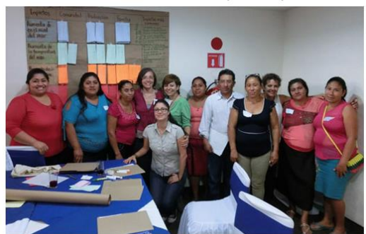
Taller con el sector social en Tabasco (INECC, 2015).