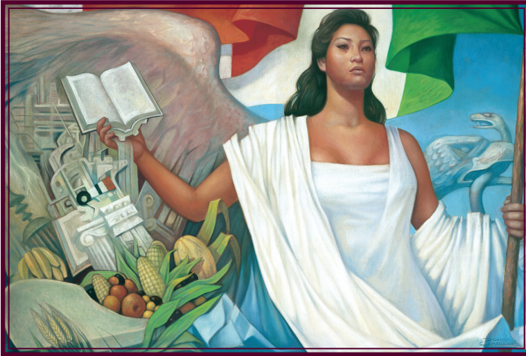
La Patria (1962), Jorge González Camarena.

Esta obra ilustró la portada de los primeros libros de texto. Hoy la reproducimos aquí para mostrarte lo que entonces era una aspiración: que los libros de texto estuvieran entre los legados que la Patria deja a sus hijos.