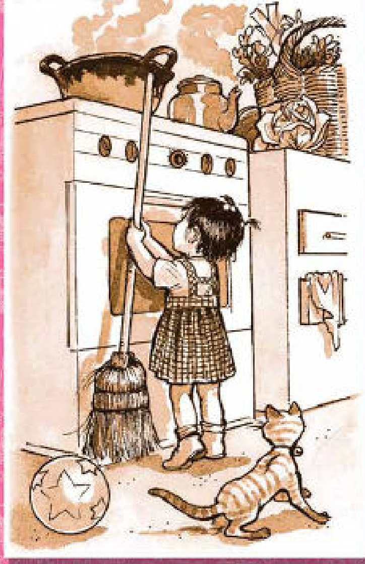
Ilustración: El bienestar de la madre, los niños y la comunidad. Salud, alimentación y comunidad segura , p. 97