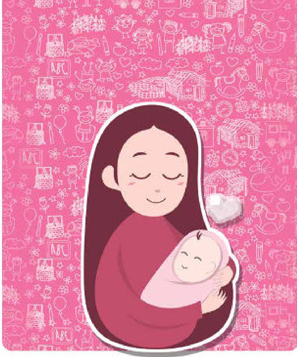
Ilustración: © Boonyen / Shutterstock.com