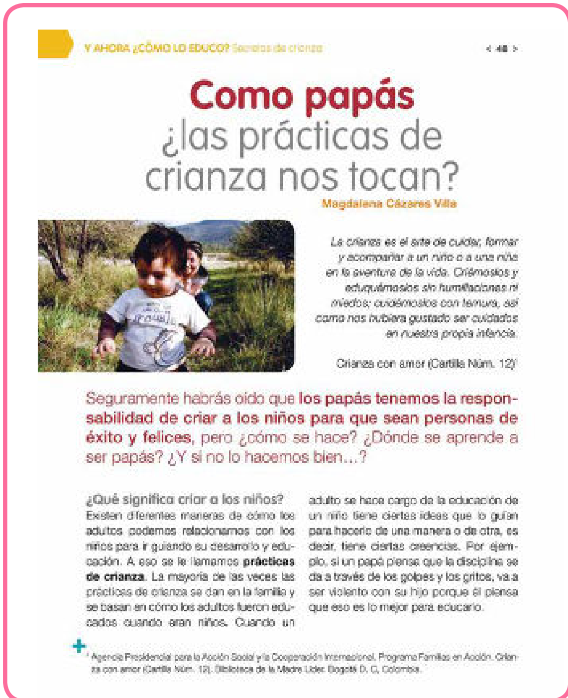
Imagen: Confecto/Conafe . Foto: Ruth Vanessa Dávila Salinas

Para profundizar en el tema, veamos el siguiente artículo de la revista Confecto (Cázares Villa 2014).