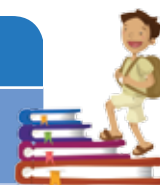
Ilustración: Ivanova Martínez Murillo