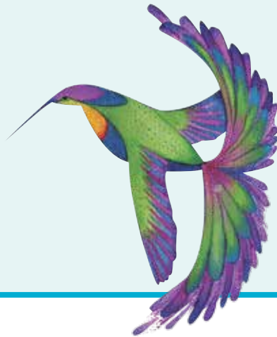
Ilustración: Héctor Gaitán-Rojó

Nu ita nuu ita kua'an tío luu. Ntukuti tuxi ti'ivi ti' vii. Ntukuti ntu'ute nu toto, ichi, ntu'ute. Nu yaiu ichi ti.