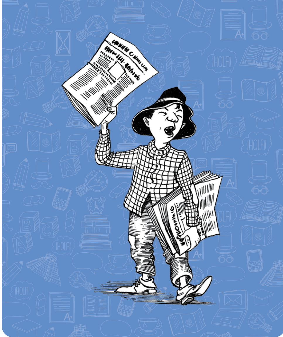
Ilustración: Rafael Barajas, El Fisgón