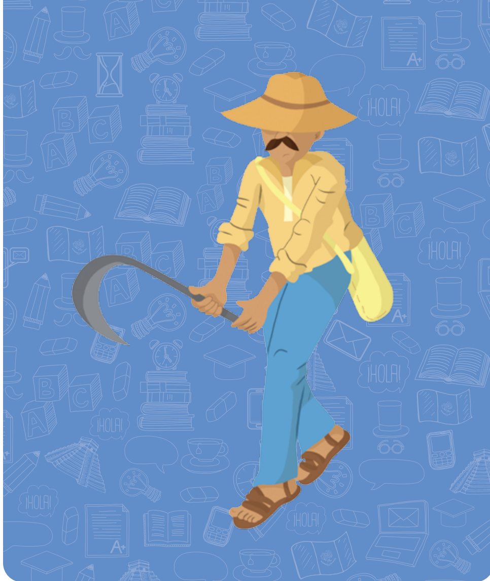
Ilustración: Iwanova Martínez Murillo