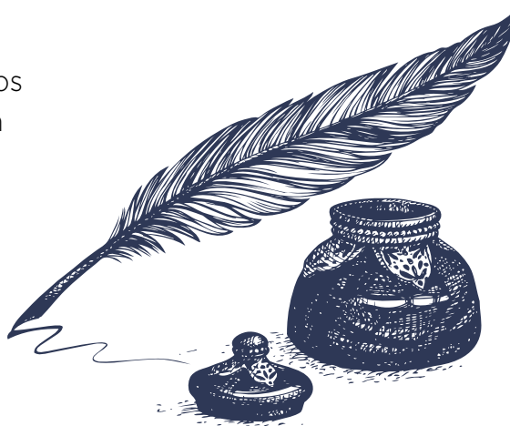
Ilustración: © ArtMari / Shutterstock.com

En esta unidad abordaremos el tema poesía tomando en cuenta lo siguiente: