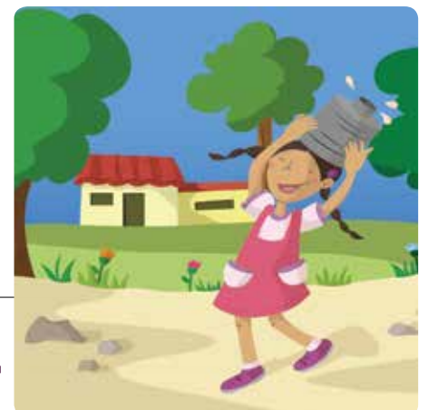
Ilustraciones: Ivanova Martínez Murillo