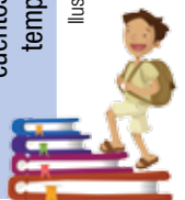
Ilustración: © Ivanova Martínez Muirillo