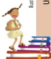
Ilustración: Ivanova Martínez Murillo