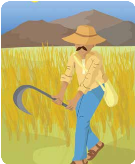
Ilustración: Ivanova Martínez Murillo

Te invitamos a que leas o escuches la siguiente poesía e identifiques sus elementos y cuáles comparten con la poesía Glosa de mi tierra .