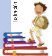
Ilustración: Ivanova Martínez Murillo