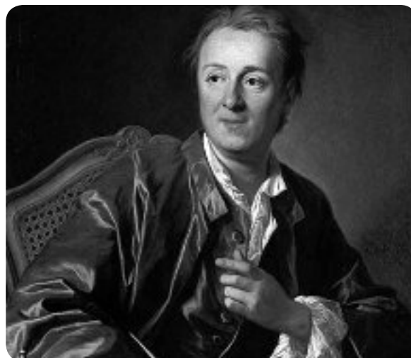
Denis Diderot (1713-1784), fue una figura importante de la Ilustración como escritor, filósofo y enciclopedista francés.