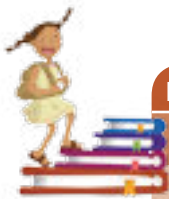
Ilustración: Ivanova Martínez Murillo

Para finalizar revisa los aprendizajes que hasta ahora has logrado. Pídele a tu tutor que te ayude a reconstruir tu proceso de estudio y a identificarlos.