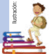
Ilustración: Ivanova Martínez Murillo