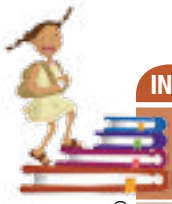
Ilustración: Ivanova Martínez Murillo