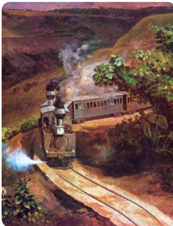
Ilustración: Detalle "El tren" José María Velasco. Colibrí/Conafe