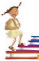
Ilustración: Ivanova Martínez Murillo

Te proponemos organizar la información de los textos que estudiaste y elaborar un ensayo que muestre tu postura ante el tema de la guerra. Ya para finalizar el estudio de tu unidad, es importante que revises junto con tu tutor el trayecto de aprendizaje, para que identifiques los aprendizajes que lograste y los que te hace falta abordar.