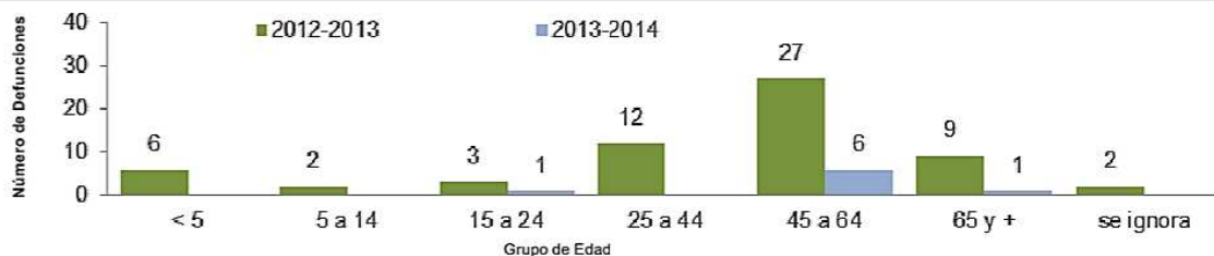
Gráfica 1. Defunciones registradas por temperaturas extremas por grupos de edad, en la Temporada Invernal, México 2012-2013 1/ y 2013-2014 2/

Fuente: SINAVE/DGE/SALUD. Sistema de Vigilancia Epidemiológica de Daños a la Salud por Temperaturas Naturales Extremas 2013; SINAVE/DGE/SALUD. Sistema de Vigilancia Epidemiológica de Daños a la Salud por Temperaturas Naturales Extremas, hasta la semana epidemiológica número 02 (Fecha de corte: 15/01/2014).