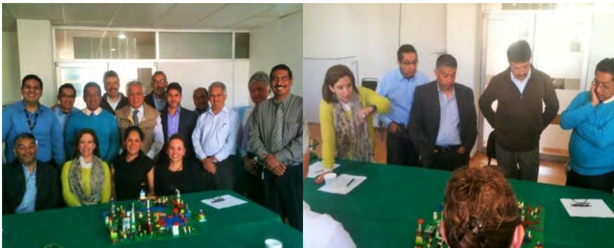
Tabla 24. Capacitación institucional en la Procuraduría Agraria

Del 1 de diciembre de 2013 al 30 de noviembre de 2014 fueron capacitados 1,192 servidores públicos, 190 en oficinas centrales y 1,002 en estructura territorial.