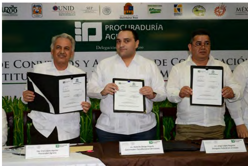
Tabla 7. Convenios suscritos por la Procuraduría Agraria

Del 1 de diciembre de 2013 al 30 de noviembre de 2014 la Procuraduría Agraria suscribió 19 convenios de colaboración con instituciones educativas, públicas y con autoridades municipales.