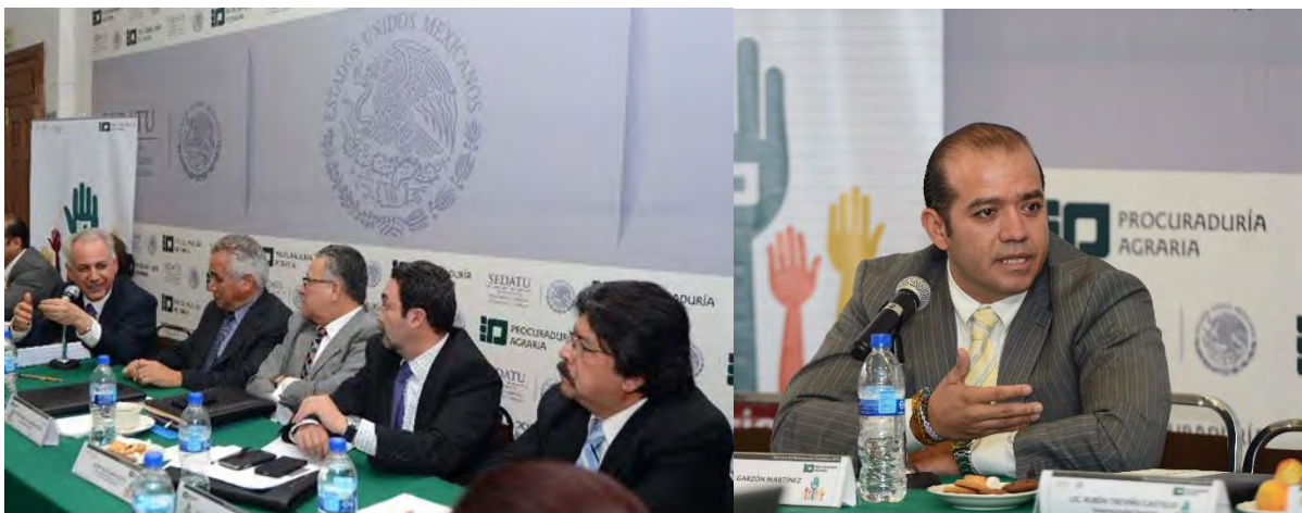
Tabla 16 Resultado del Ejercicio de Participación Ciudadana 2014

El pasado 16 de julio del año en curso se llevó a cabo el Ejercicio de Participación Ciudadana 2014 de la Procuraduría Agraria, en cumplimiento a las Bases de Colaboración del programa para un Gobierno Cercano y Moderno, en el cual se recibieron 16 propuestas por parte de los representantes de la sociedad civil convocados. En la tabla 16 se detallan las unidades administrativas involucradas con las propuestas y el estado que guardan.