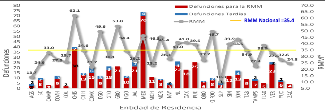
Gráfica 2. Mortalidad Materna por Entidad de Residencia y RMM 2016

Las entidades federativas que presentan una RMM mayor a la nacional son: Chiapas, Durango, Guerrero, Edo. De México, Morelos, Nuevo León, Oaxaca, Puebla, Quintana Roo, Sinaloa, Sonora y Tlaxcala. (Gráfica 2)