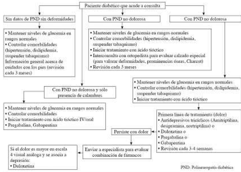
Algoritmo para el manejo del paciente con polineuropatía diabética