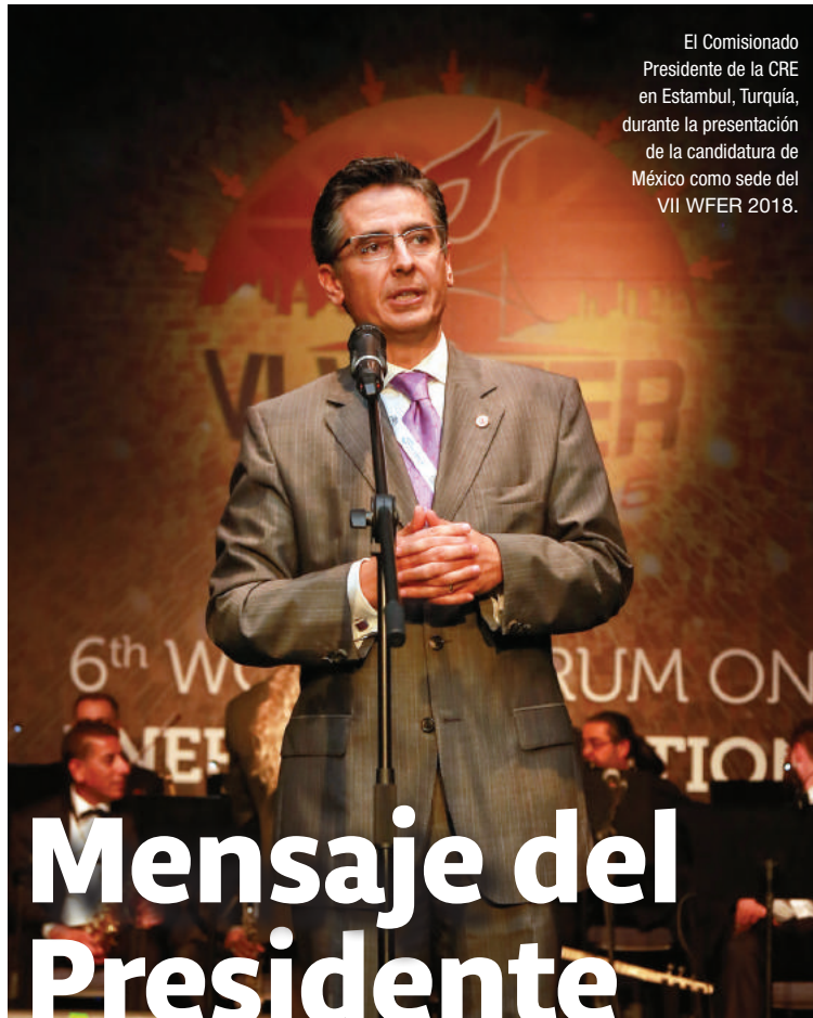
El Comisionado Presidente de la CRE en Estambul, Turquía, durante la presentación de la candidatura de México como sede del VII WFER 2018.

Av. Horacio #1750 Col. Los Morales Polanco México, D. F. C. P. 11510 Tels. 52831500 52831515