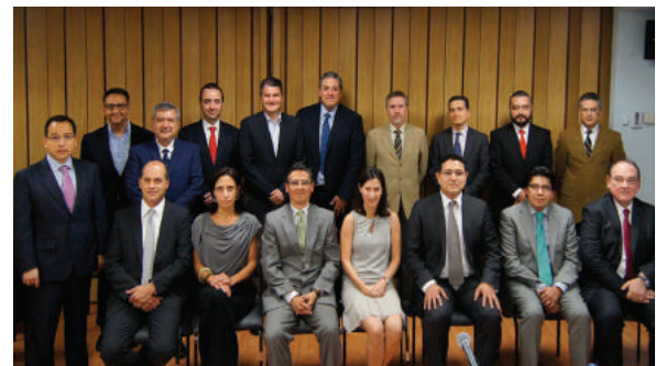
MIEMBROS del Consejo Consultivo en materia de hidrocarburos de la CRE.

Los miembros electos durarán en su cargo 3 años prorrogables por una sola ocasión, y se trata de cargos honoríficos que no generan relación laboral alguna.