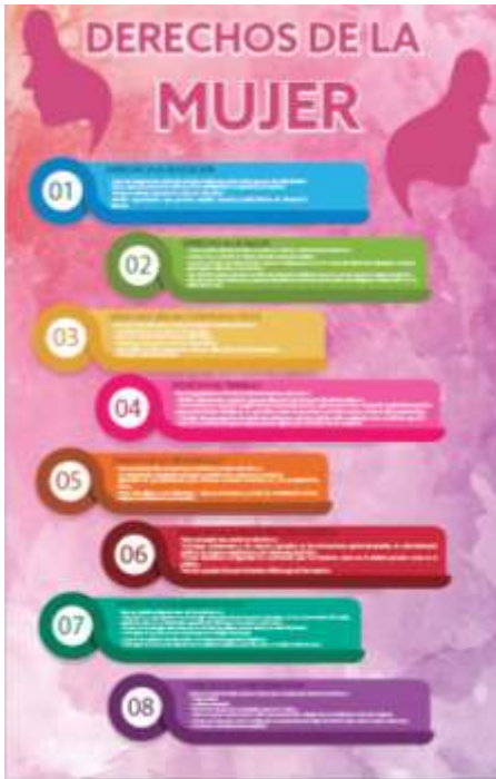
(Cartel en español y Maya)