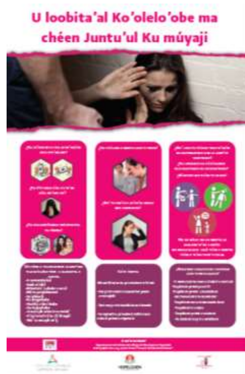
(Cartel en español y Maya)