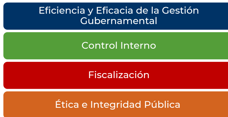
Figura 1. Pilares de la Evaluación de la Gestión Gubernamental