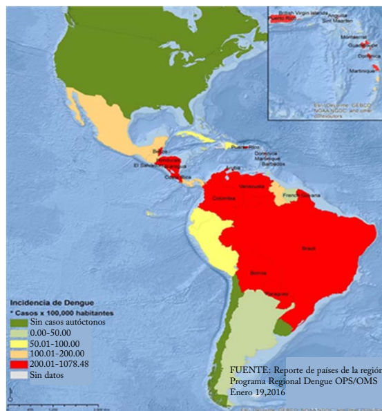
FIGURA 2. INCIDENCIA DE DENGUE EN LAS AMÉRICAS 2014. HASTA LA SE 53

FUENTE: Número de casos notificados de Dengue y Dengue severo (DS) en las Américas, por país: semana epidemiológica / SE 10 (actualizado 11 de marzo de 2016) OMS/OPS