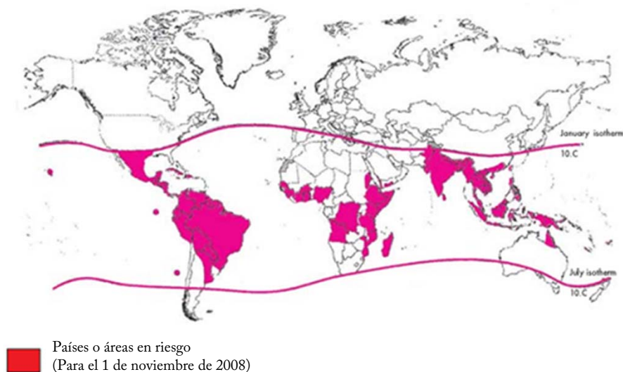
FIGURA 1: PAÍSES / ÁREAS EN RIESGO DE TRANSMISIÓN DEL DENGUE, 2008

FUENTE: Mapa de la Organización Mundial de la Salud. Información de Salud Pública y Sistemas de Información Geográfica (SIG).