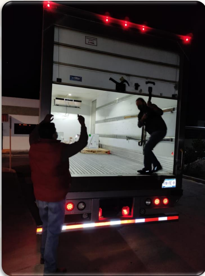
Corte al 10 de enero de 2022