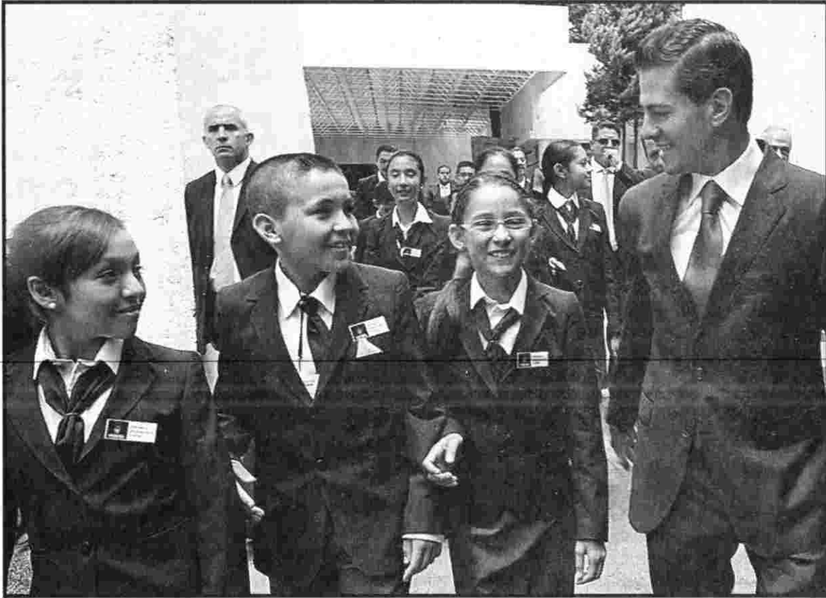
El presidente Enrique Peña Nieto recibió en Los Pinos a los niños ganadores de la Olimpiada del Conocimiento Infantil 2015, quienes recorrieron la residencia oficial.

residencia oficial de Los Pinos, el primer mandatario invitó a los alumnos a tomarse una foto con él en los jardines de la casa presidencial.