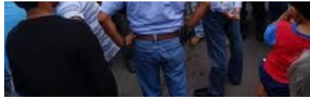
Habitantes de Zongolica amenazan con manifestarse