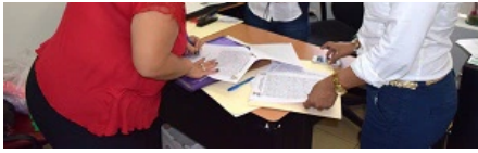
Reintegra DIF de Córdoba a 45 menores a nuevos hogares