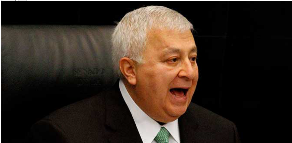
Emilio Chuayffet

El secretario de Educación Pública, Emilio Chuayffet Chemor, anunció una inversión superior a mil millones de pesos para el mejoramiento y aumento de la infraestructura educativa en Oaxaca, así como diversas medidas para revertir tendencias perniciosas, en beneficio de los niños y jóvenes, y ratificó que los derechos de maestros y maestras serán plenamente respetados.