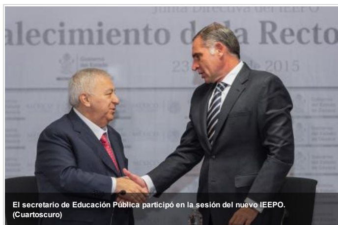
El secretario de Educación Pública participó en la sesión del nuevo IEEPO.

OAXACA.- El Gobierno Federal invertirá mil millones de pesos para mejorar y aumentar la infraestructura educativa en Oaxaca , anunció el titular de la Secretaría de Educación Pública, Emilio Chuayffet Chemor durante la sesión de la Junta Directiva del nuevo IEEPO.