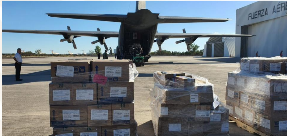
Entrega en Baja California Sur