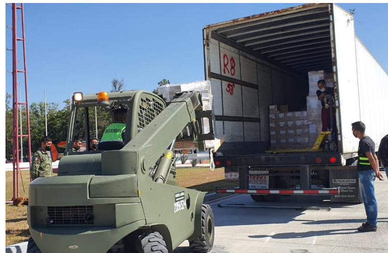
Entrega en Chiapas