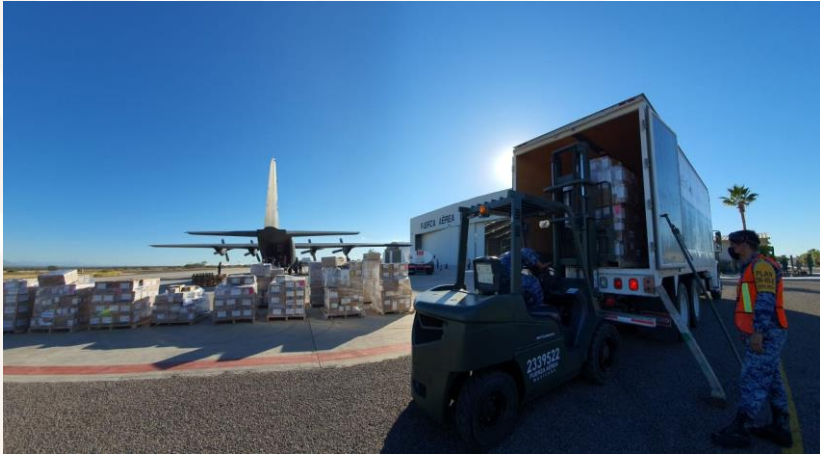
Entrega en Baja California Sur