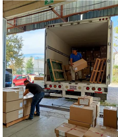
Entrega en Zacatecas