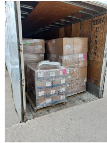
Entrega en Veracruz