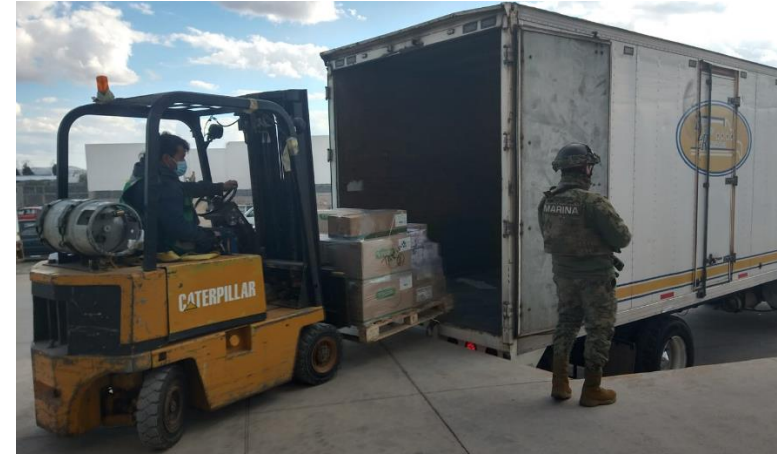
Entrega en Hidalgo