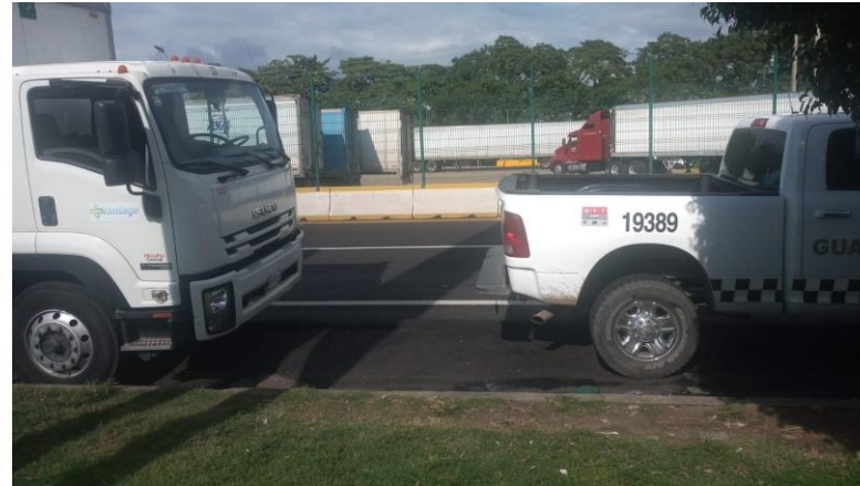
Seguimiento de actividades del operador logístico