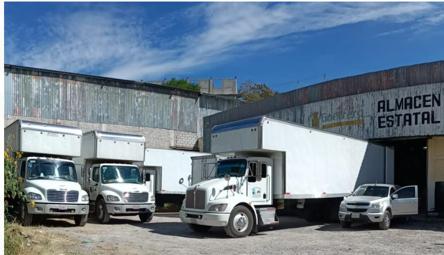
Entrega en Guerrero