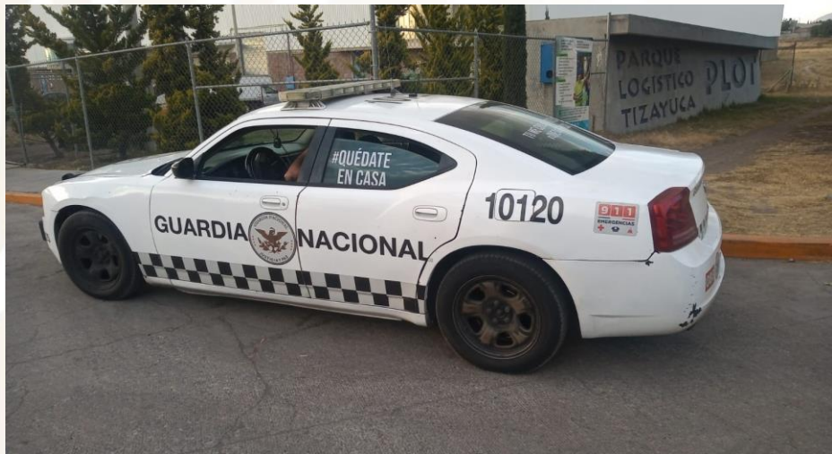
Entrada del Operador Logístico