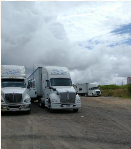
Entrega en Oaxaca