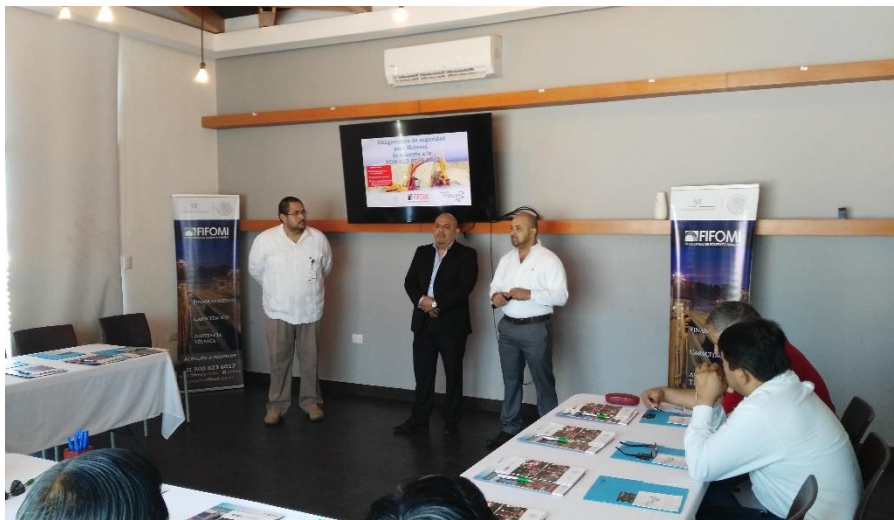
Curso de capacitación en conjunto con el Fideicomiso de Fomento Minero (FIFOMI) 05 de diciembre de 2015.

En esta Delegación, en el periodo que se informa, se recibieron y atendieron 7 solicitudes.