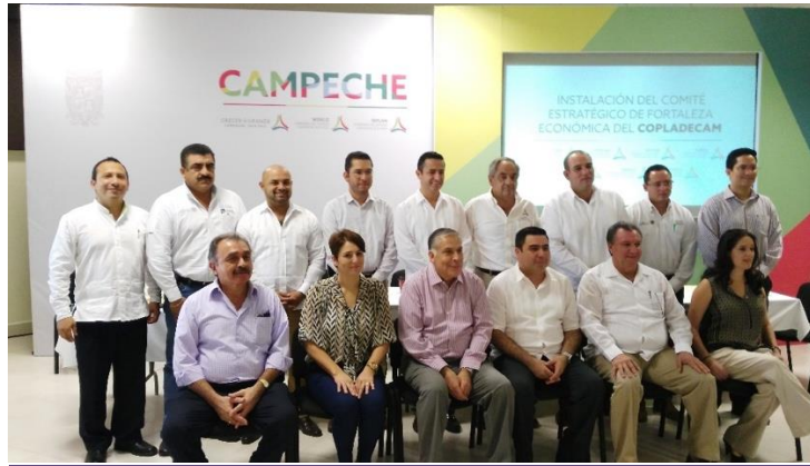
Instalación del Subcomité Sectorial de Desarrollo Económico y Comité Estratégico de Fortaleza Económica del COPLADECAM 11 de diciembre de 2015.