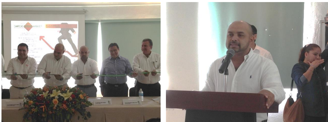
Inauguración del evento: Campeche Emprende Ahora, Instalaciones del CCE, 5 de octubre de 2015.

Como resultado de la difusión de la Red y el interés demostrado por emprendedores y empresarios se han realizado 305 registros de emprendedores y 150 registros de micro y pequeñas empresas a la Red de Apoyo al Emprendedor.