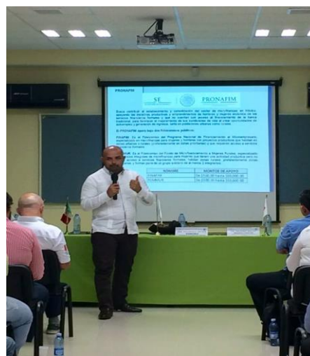
Entrega de equipos tecnológicos a los afiliados a CANACINTRA 14 de diciembre de 2015 y Conferencia sobre los programas INADEM y Secretaría de Economía en el Centro Coordinador Empresarial (CCE) Ciudad del Carmen 17 de diciembre de 2015.