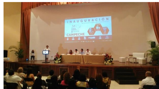
Inauguración y recorrido de la Expo Congreso Mujer Campechana, 30 de octubre de 2015 y Convención Nacional de Mujeres Industriales, 25 de noviembre de 2015.