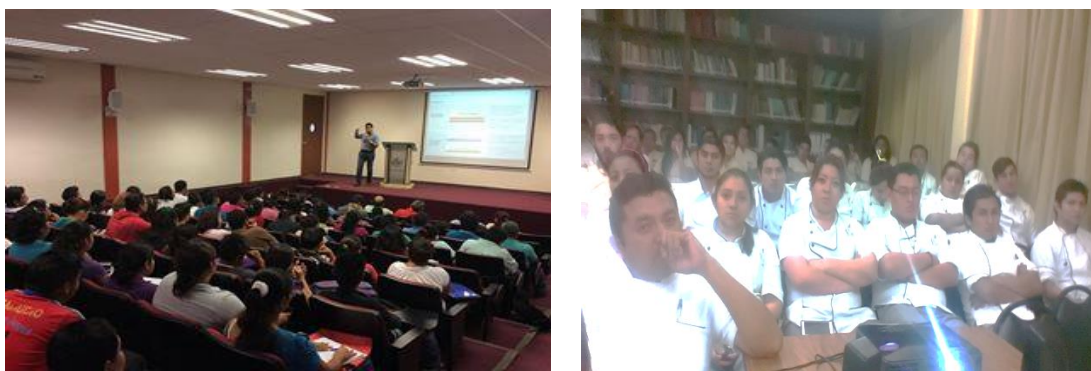
Eventos en Instituciones educativas, 10 de marzo de 2015.

De igual forma, a través de la convocatoria 3.1 “Profesionalización de capacidades financieras y generación de contenidos que impulsen al ecosistema emprendedor de alto impacto y a las MIPYMES”, se aprobó $441,000.00, y para la convocatoria 5.1 “Incorporación de Tecnologías de Información” se aprobó $6,188,540.00.