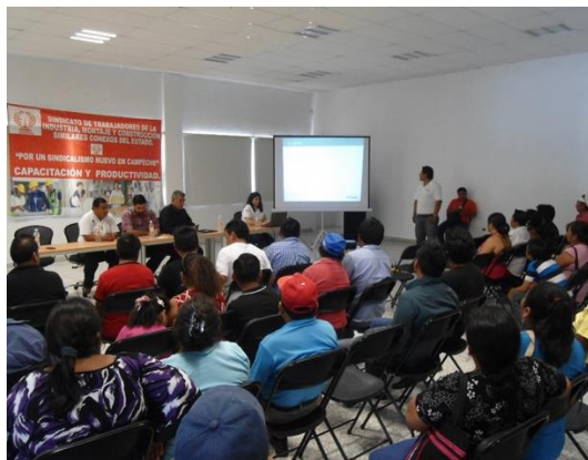
Presentación de las Convocatorias 2.3, 5.1 y 5.3 del INADEM, PRONAFIM y el SNIIM, 28 de julio de 2015.