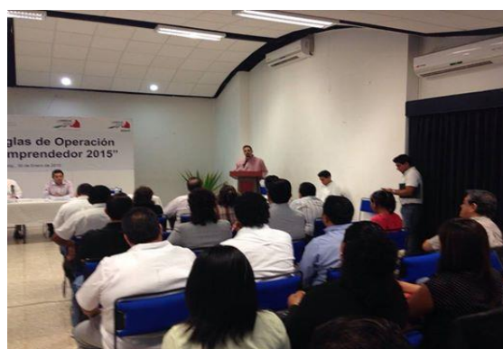
Presentación de las Reglas de Operación del Fondo Nacional Emprendedor 2015, Auditorio de CANACINTRA Campeche, 30 de enero de 2015.