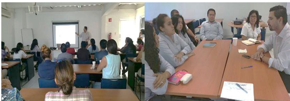
Reunión con emprendedores y la Incubadora Centro de Incubación y Liderazgo, 26 febrero 2015

En Campeche se cuenta con cuatro incubadoras que han obtenido su reconocimiento por parte del INADEM, con las cuáles esta Delegación mantuvo un estrecho acercamiento, asesorando y orientando emprendedores y empresarios para alcanzar y obtener sus reconocimientos.