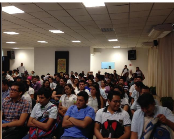
Participación de la Delegación en el evento: Congreso Universitario con la conferencia Programas de Financiamiento del INADEM, 22 de octubre de 2015.