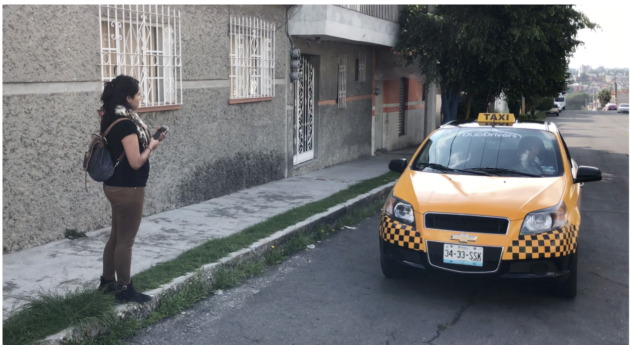
Usaria de ProTaxi.