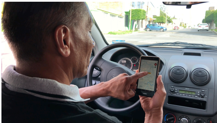
Conductor y aplicación móvil ProTaxi.

Para el desarrollo de la aplicación se realizaron estudios comparativos con las ERTs existentes y se realizaron grupos de trabajo con los taxistas para definir el esquema tarifario, ya que son los operadores los que definen las tarifas de cobro y normalmente el cobro se realiza por la distancia. Resultado de los grupos de trabajo se estableció una tarifa inicial para favorecer a las personas usuarias.