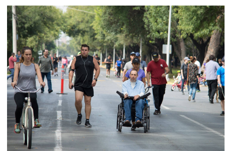
Las vías recreativas son inclusivas.

Número de asistentes (10% de la población en el municipio)