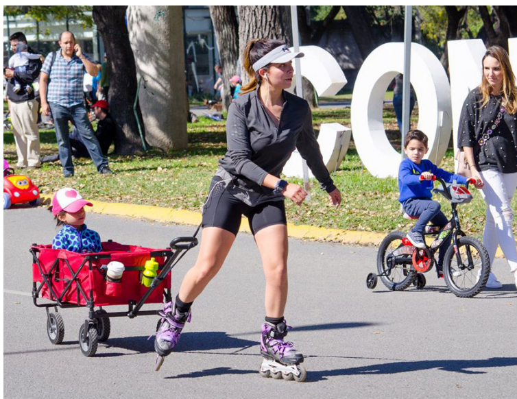
San Pedro de Pinta.

La iniciativa busca cambiar el paradigma de la movilidad. De igual manera, en el momento que se planteó la vía recreativa, la ZMM se encontraba en una etapa de inseguridad en la cual la gente no quería salir de sus casas, más que para recorridos obligatorios como el trabajo y la escuela. San Pedro de Pinta se creó con la premisa de decir: Aquí estamos en nuestras calles y seremos resilientes, saldremos a disfrutar de nuestra ciudad y nos vamos a cuidar entre todos. Y por último, enseñar a las nuevas generaciones un modelo de ciudad distinto, en el cual cerrar una calle, moverse a pie o en bicicleta es algo normal, priorizando siempre a las personas antes que a los vehículos particulares motorizados.