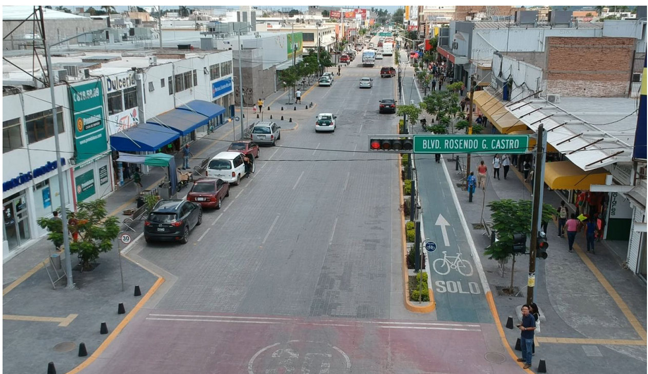
Toma aérea de la Zona 30 de Los Mochis.