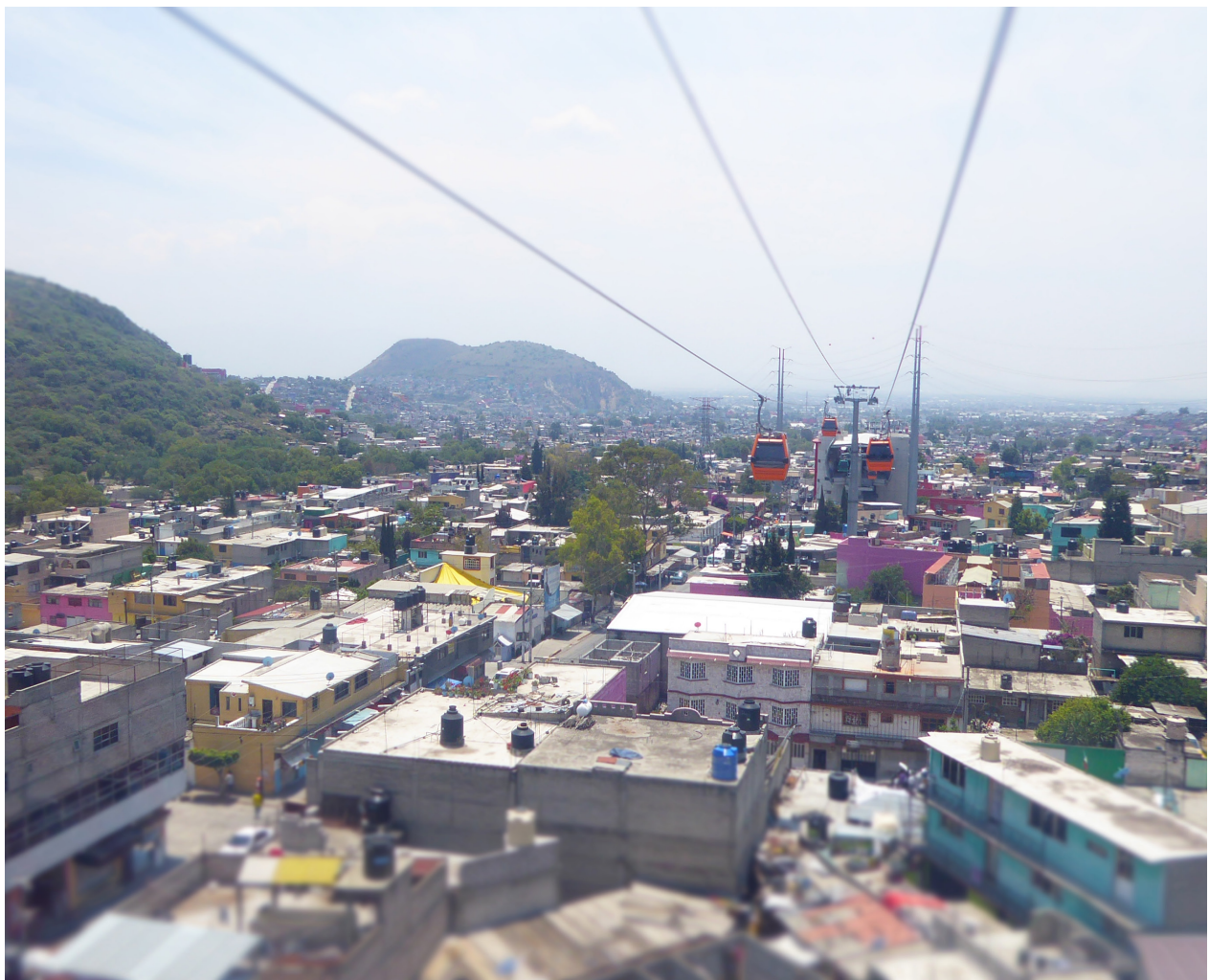
Mexicable Ecatepec.

Federal, Estatal, Municipal y Sector privado Origen de los recursos