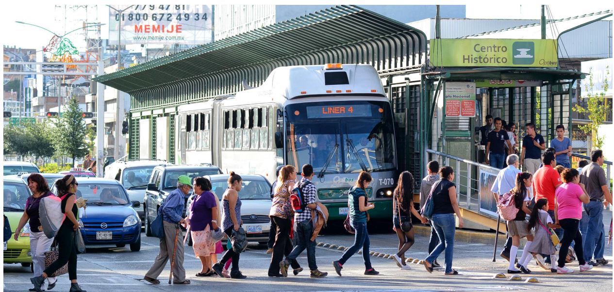
SIT Optibús.