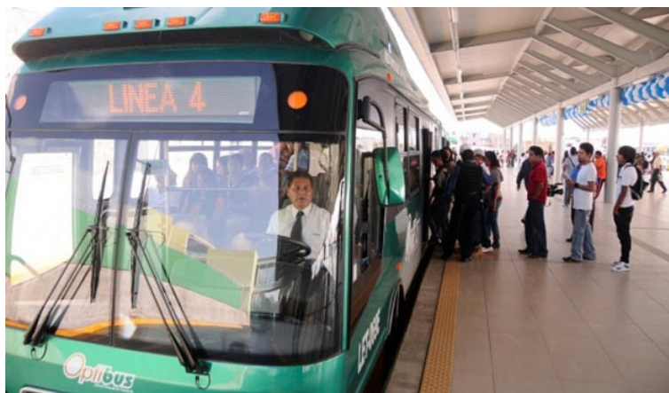
Estación Optibús.

Federal, Estatal, Municipal y Sector privado 1 Origen de los recursos