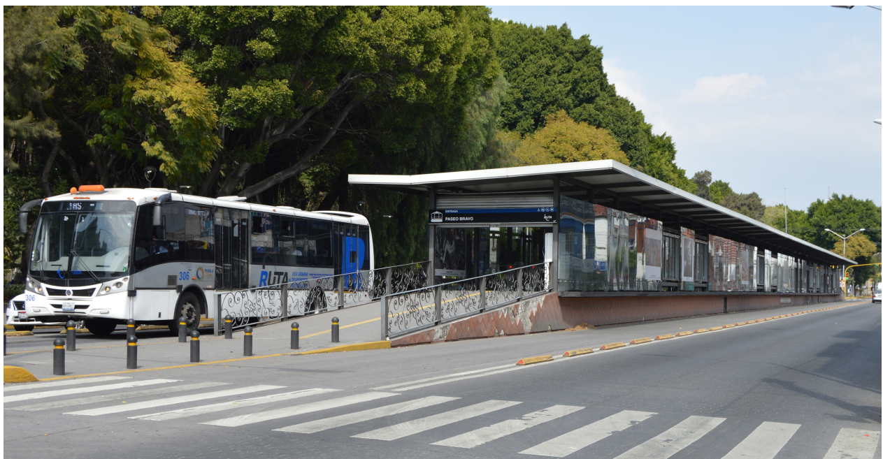
El SIT Ruta de Puebla obtuvo recursos del PROTRAM.