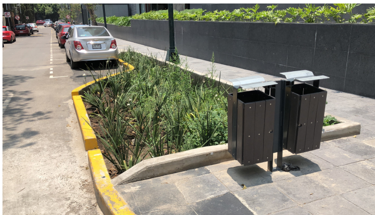
Implementación de infraestructura verde en el diseño vial de Ciudad de México.

Aunque inicialmente fue desarrollado en respuesta de la necesidad específica de municipios fronterizos con climas cálidos, resultó en lineamientos y recomendaciones que aplican para todos los municipios de México.