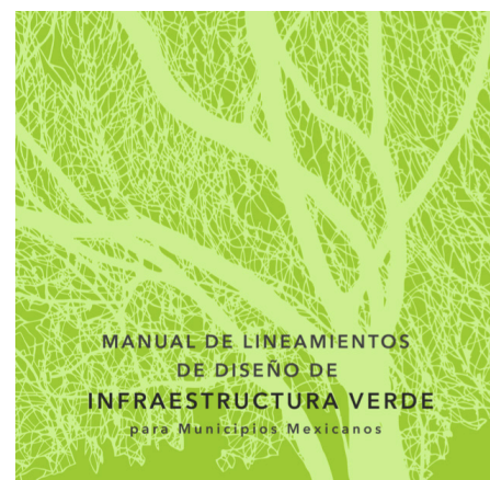
Manual de Lineamientos de Diseño de Infraestructura Verde para Municipios Mexicanos.