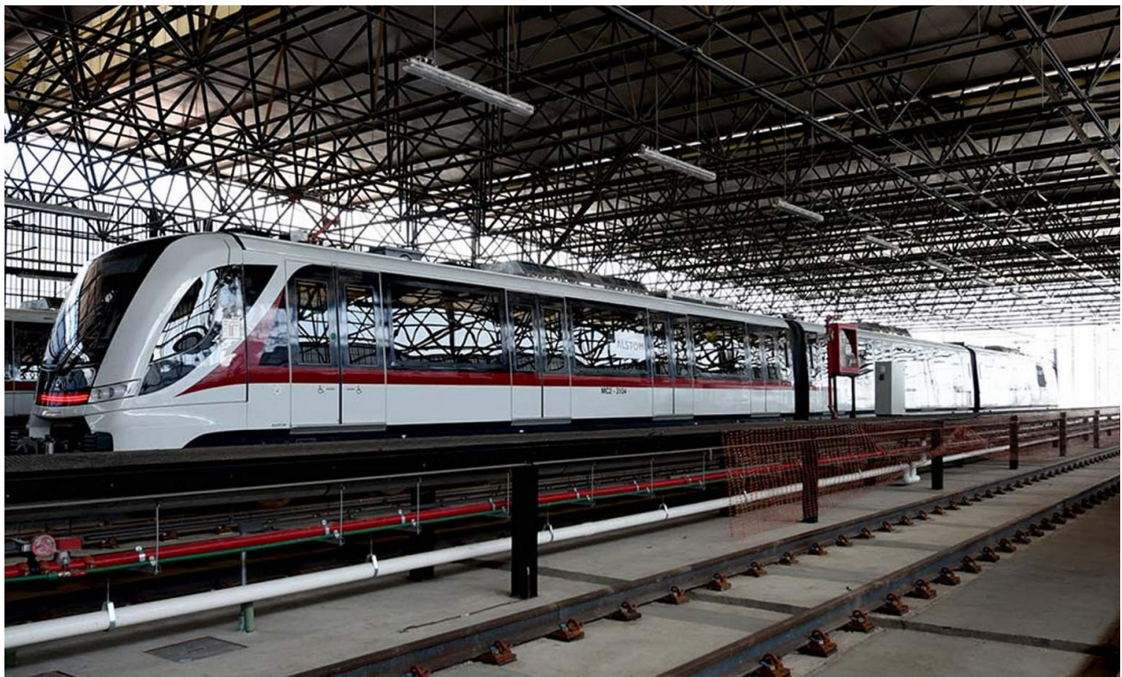
Tren ligero.

Congreso del Estado de Jalisco dependencia responsable