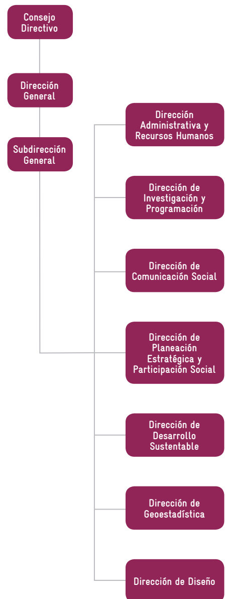
Estructura orgánica del Instituto Municipal de Planeación.