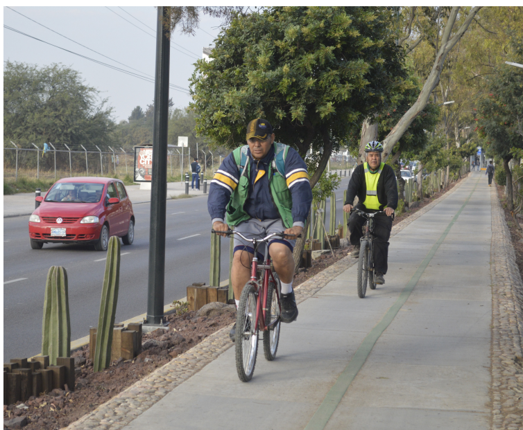
Ciclovía bidireccional en el Bulevar Torres Landa.

A pesar de que la movilidad urbana no figura dentro de sus atribuciones de manera directa, se ha involucrado activamente en la coordinación y desarrollo de diferentes proyectos, e instrumentos de movilidad. Incluso, en diferentes ciudades del país, son estos institutos quienes han liderado las iniciativas de movilidad cuando se carece de una dependencia especializada en la materia.