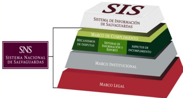
Figura 1. El diseño e implementación del SNS, considera los aspectos del marco legal, institucional y de cumplimiento que son relevantes a las salvaguardas REDD+.

A continuación se describen los tres elementos que componen el SNS: