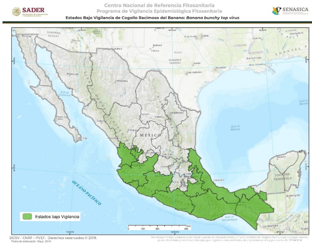
Figura 2. Estados de la República Mexicana bajo vigilancia epidemiológica de 2019.