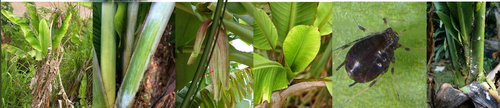
Scot, 2004; University of Hawaii, 2006.