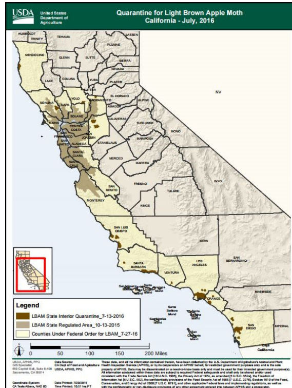
Figura 2. Condados con detecciones de Epiphyas postvittana en Estados Unidos (NAPPO, 2016).