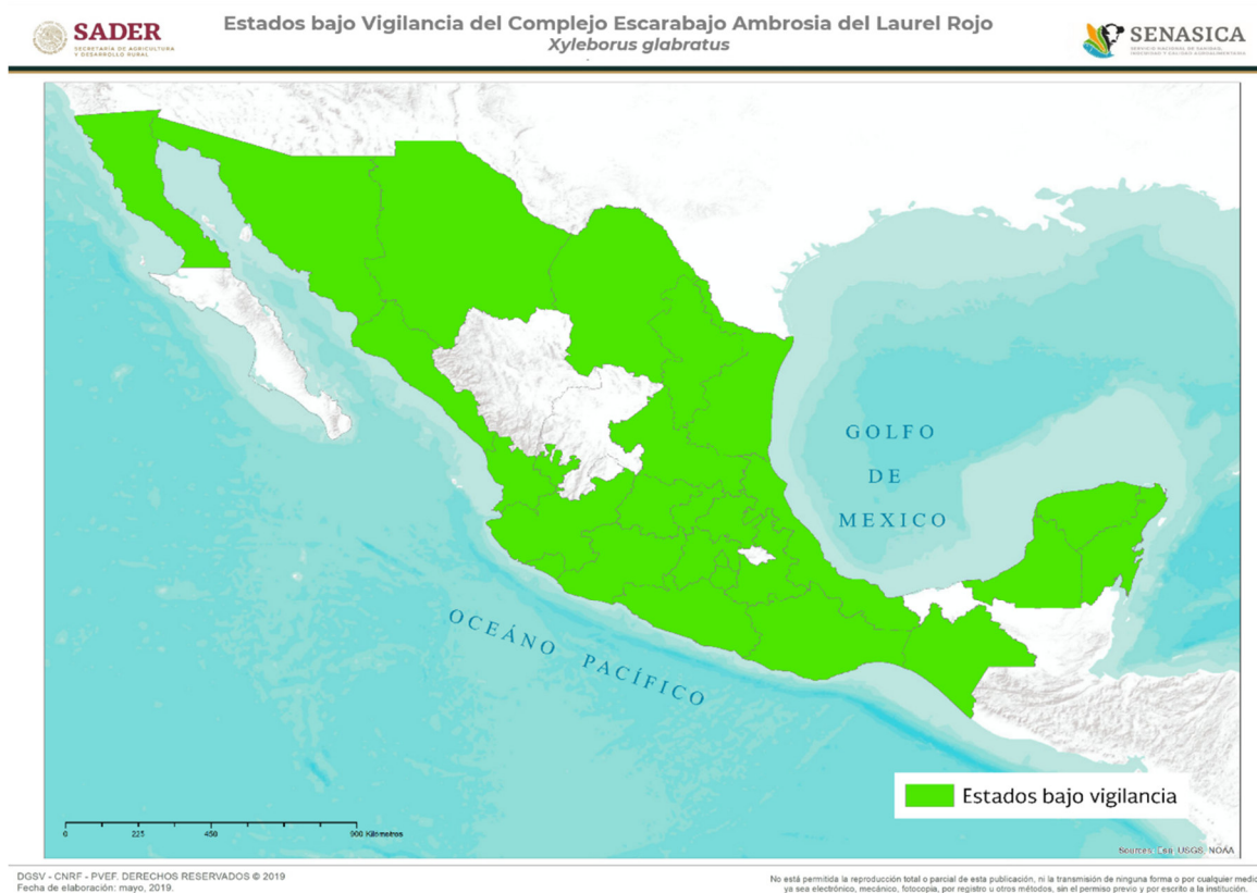
Figura 2. Vigilancia Epidemiológica Fitosanitaria para Xyleborus glabratus . Elaboración propia con datos de SADER-SENASICA-PVEF, 2019.

En el 2018, las acciones para la vigilancia de X. glabratus incluye la exploración de 14,622 ha., 174 rutas de trampeo, así como 1,977 trampas instaladas y 111 rutas de vigilancia, implementadas en los estados de Baja California, Campeche, Coahuila, Colima, Chiapas, Chihuahua, Ciudad de México, Jalisco, Estado de México, Michoacán, Nayarit, Nuevo León, Puebla, Quintana Roo, San Luis Potosí, Sinaloa, Sonora, Tamaulipas, Veracruz y Yucatán, (Figura 2) [SADER-SENASICA-PVEF, 2019a] en huertos comerciales de aguacate y zonas identificadas como de mayor riesgo, así como la instalación y revisión periódica de plantas centinela (80) en puntos de ingreso del territorio nacional (SADER-SENASICA-PVEF, 2019b). Derivado de esas acciones, a la fecha no se han detectado especímenes positivos, por lo que con base a lo anterior y de acuerdo con la Norma Internacional para Medidas Fitosanitarias (NIMF) No. 08 de la Convención Internacional de Protección Fitosanitaria (CIPF) el estatus del complejo escarabajo ambrosia del laurel rojo es Ausente en el territorio nacional.