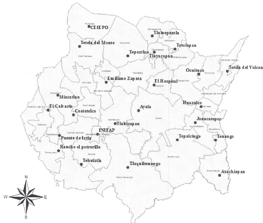
Figura 1.- Distribución geográfica de las 25 estaciones agroclimatólogicas del estado de Morelos.

En la actualidad, la red está formada por 25 estaciones (Figura 1) operando sin interrupciones; las cuales requieren mantenimiento preventivo y correctivo, así como la actualización constante del portal con la información que se ofrece al usuario. Al mismo tiempo se tiene consolidada la base datos agroclimatólogicos de Morelos del periodo 2006 – 2014.