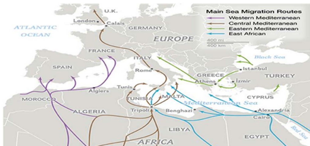
FIGURA 2. RUTAS MIGRATORIAS DEL MAR MEDITERRÁNEO