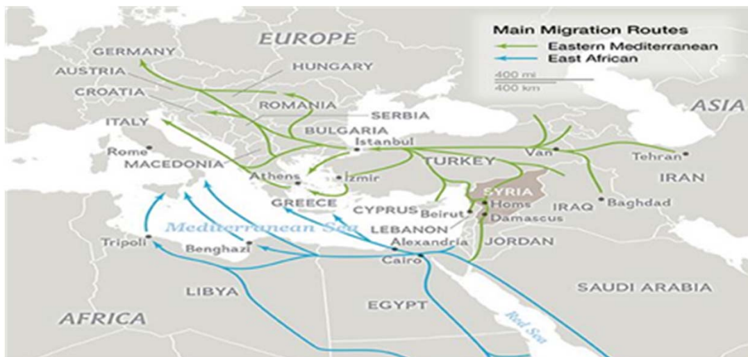
FIGURA 1. RUTAS MIGRATORIAS ORIENTAL Y AFRICANA