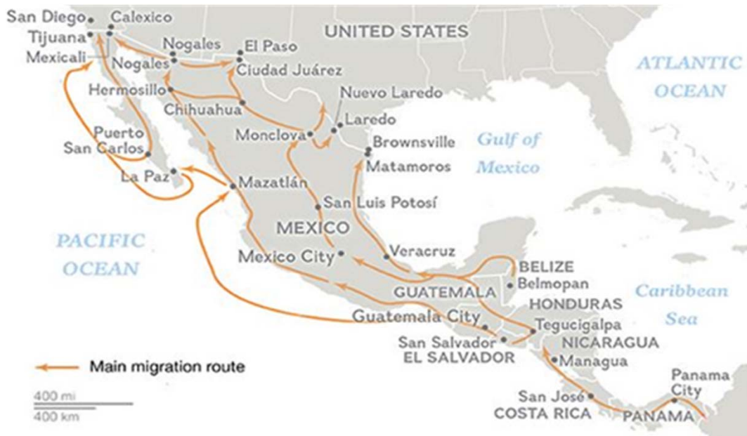
FIGURA 3. RUTA DE AMÉRICA CENTRAL