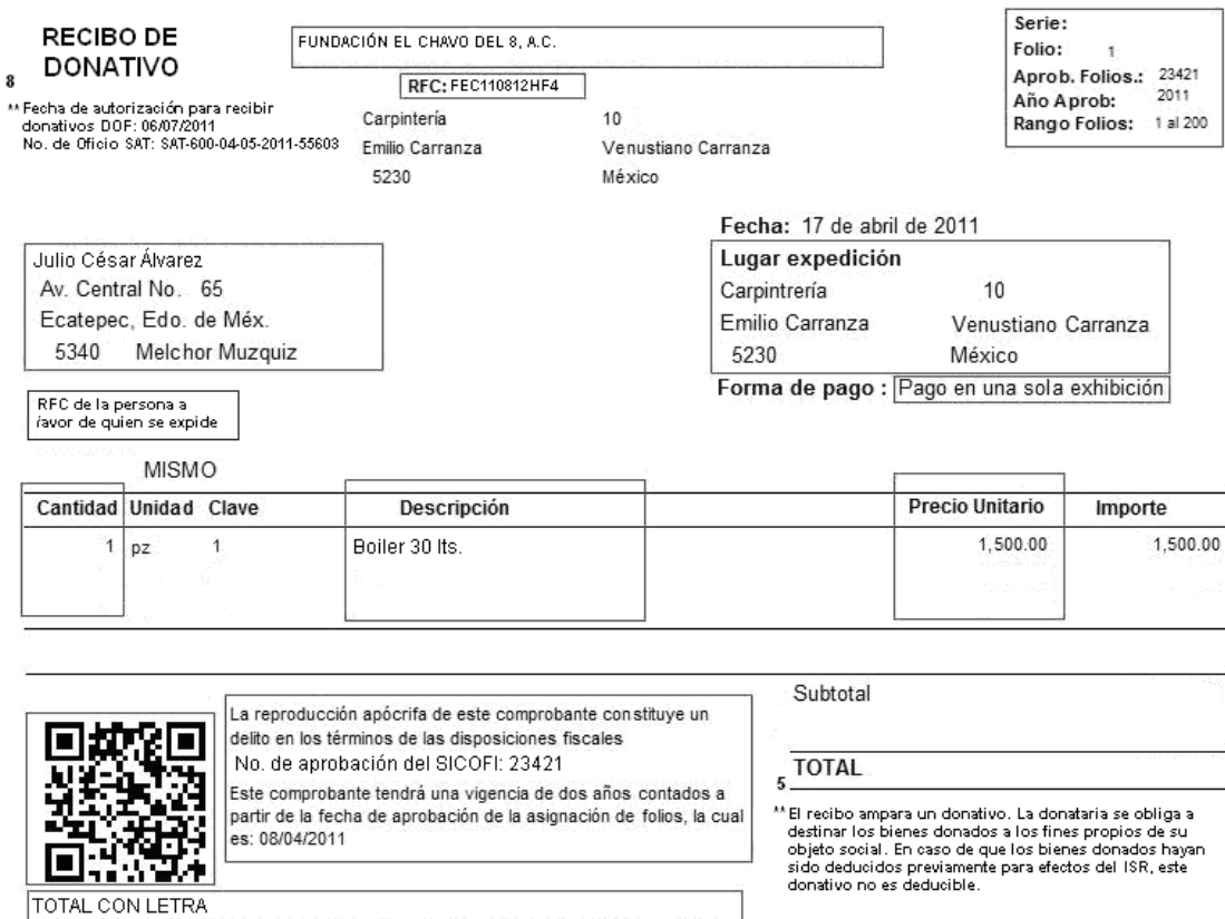
Figura 1.4. Modelo de Recibo de Donativo Electrónico