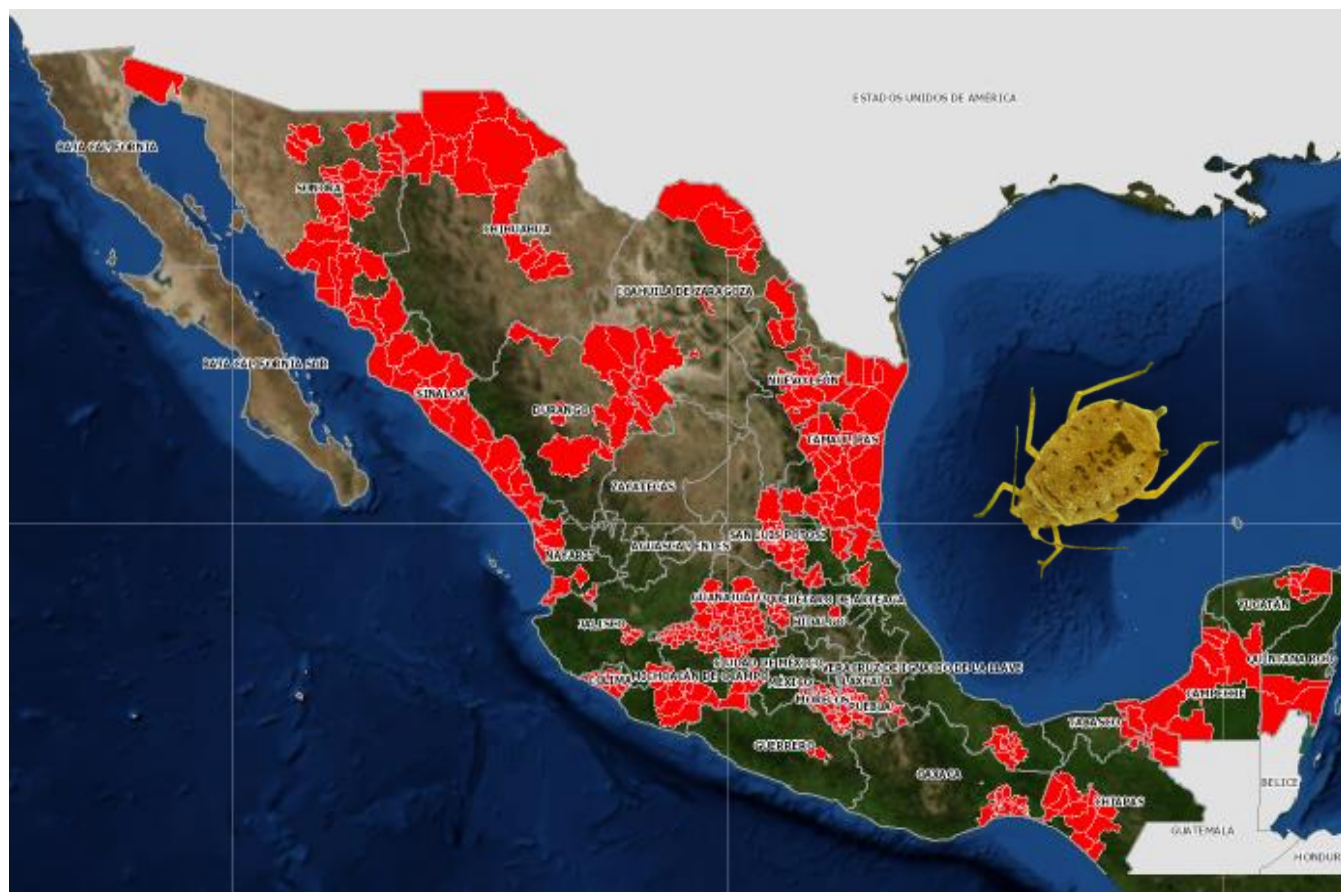
Figura 1. Distribución del pulgón amarillo del sorgo en el territorio nacional.

El pulgón amarillo ( Melanaphis sacchari ), es una plaga de reciente introducción a México. Debido a su alta capacidad de dispersión y elevado potencial de reproducción se ha establecido en prácticamente todo el territorio nacional, afectando principalmente al cultivo del sorgo. En el ejercicio 2016, se implementó un esquema de manejo integrado, obteniéndose resultados muy favorables en el manejo de la plaga y en la producción, ya que no se registró pérdidas por daños en el cultivo.