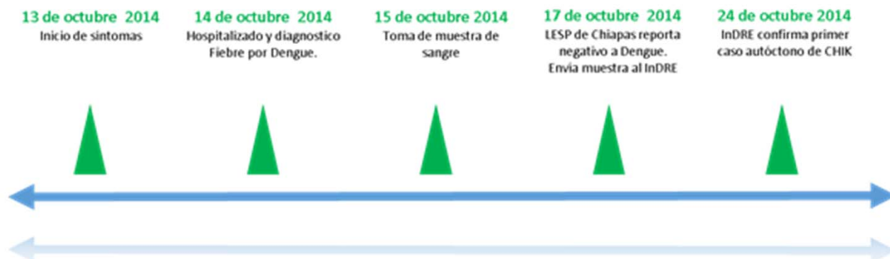
FIGURA 2. LÍNEA DEL TIEMPO DEL SUCEDIDO CON EL PRIMER CASO AUTÓCTONO DE CHIK EN MÉXICO.

El 7 de noviembre del mismo año, México notificó por RSI a través del CNE , el primer caso autóctono confirmado por el laboratorio de Arbovirus y Virus Hemorrágico del InDRE . El caso corresponde a una escolar de 8 años de edad, originaria de Arriaga, Chiapas, sin antecedente de viaje a otro país. A continuación se presenta la descripción del caso 6,7 (Imagen 2).