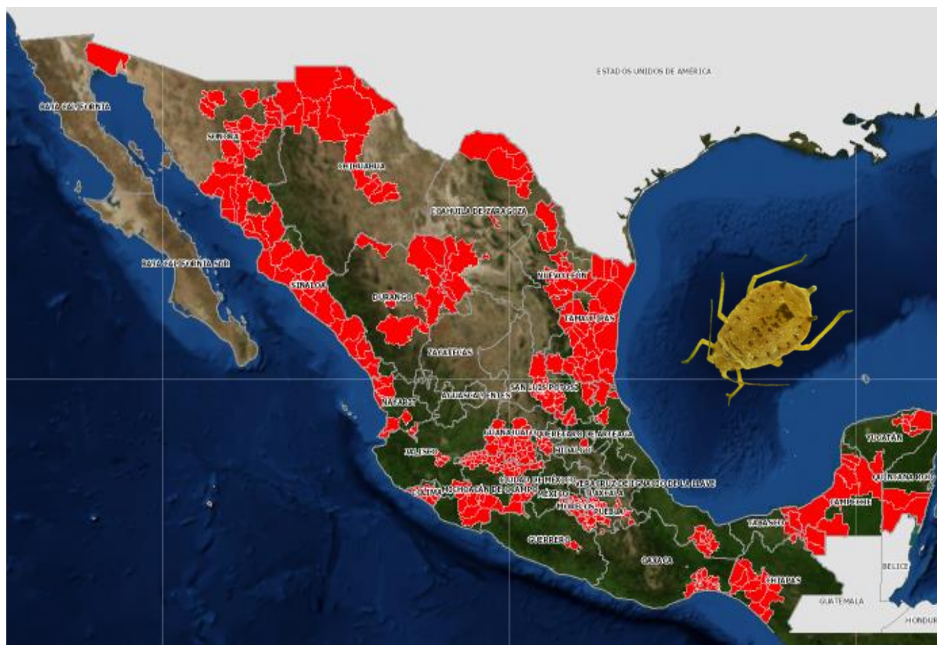
Figura 1. Distribución del pulgón amarillo del sorgo en el territorio nacional.

El pulgón amarillo ( Melanaphis sacchari ), es una plaga de reciente introducción a México. Debido a su alta capacidad de dispersión y elevado potencial de reproducción se ha establecido en prácticamente todo el territorio nacional, afectando principalmente al cultivo del sorgo. En el ejercicio 2016, se implementó un esquema de manejo integrado, obteniéndose resultados muy favorables en el manejo de la plaga y en la