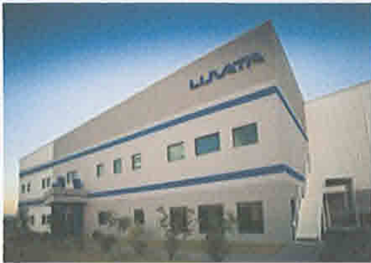
LUVATA MONTERREY S. DE R.L. DE C.V.