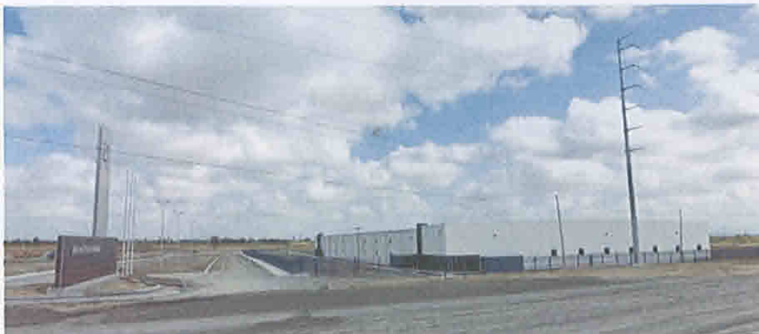
NORTH POLE STAR, S. DE R.L. DE C.V.