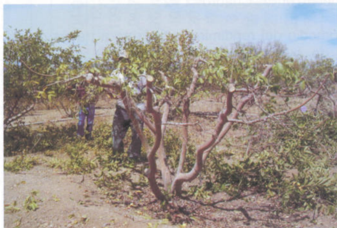
Figura 1. Aspectos de la poda anual de los guayabos en el Área Experimental de "Los Cañones" en Huanusco, Zac.

Se realizaron dos deshierbes manuales por año (julio y septiembre), con el objetivo de mantener libre de malezas al cultivo. Para el control del picudo de la guayaba ( Conotrachelus spp.) se aplicó Malatión CE 50 en dosis de 250 cc/100 litros de agua y para la mosca de la guayaba ( Anastrepha striata ) se aplicó insecticida cebo elaborado con cuatro partes de proteína hidrolizada, una parte de Malatión y 95 partes de agua en octubre.