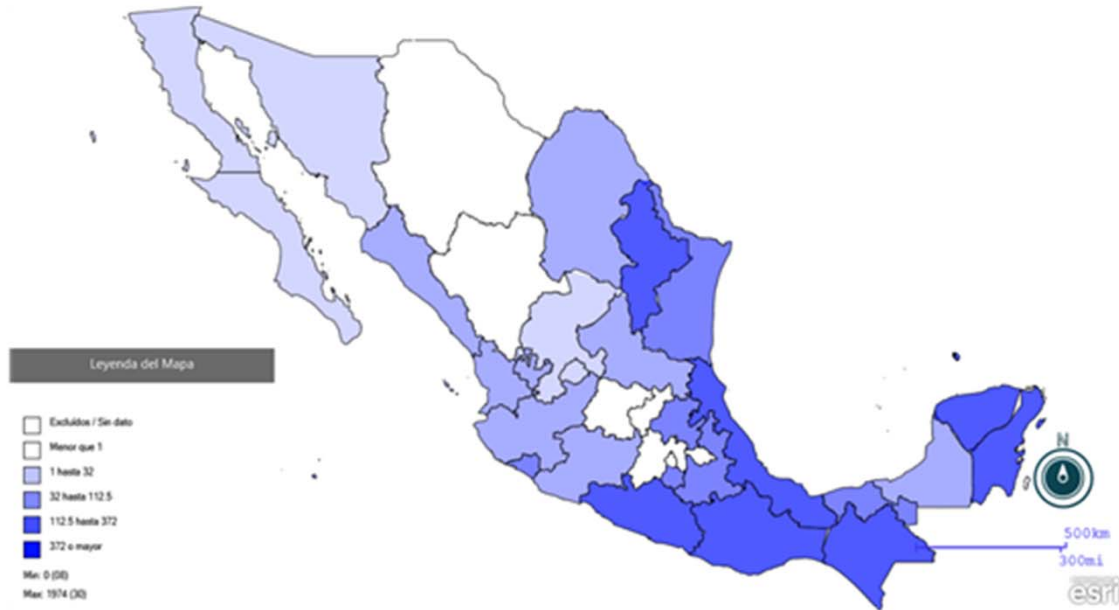
FIGURA 3. DISTRIBUCIÓN DE CASOS CONFIRMADOS AUTÓCTONOS DE ENFERMEDAD POR VIRUS ZIKA EN EMBARAZADAS POR ENTIDAD FEDERATIVA, EN MÉXICO 2015-2017*