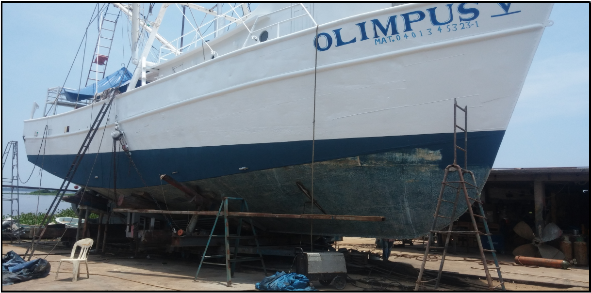
IMAGEN 79: VARADERO.