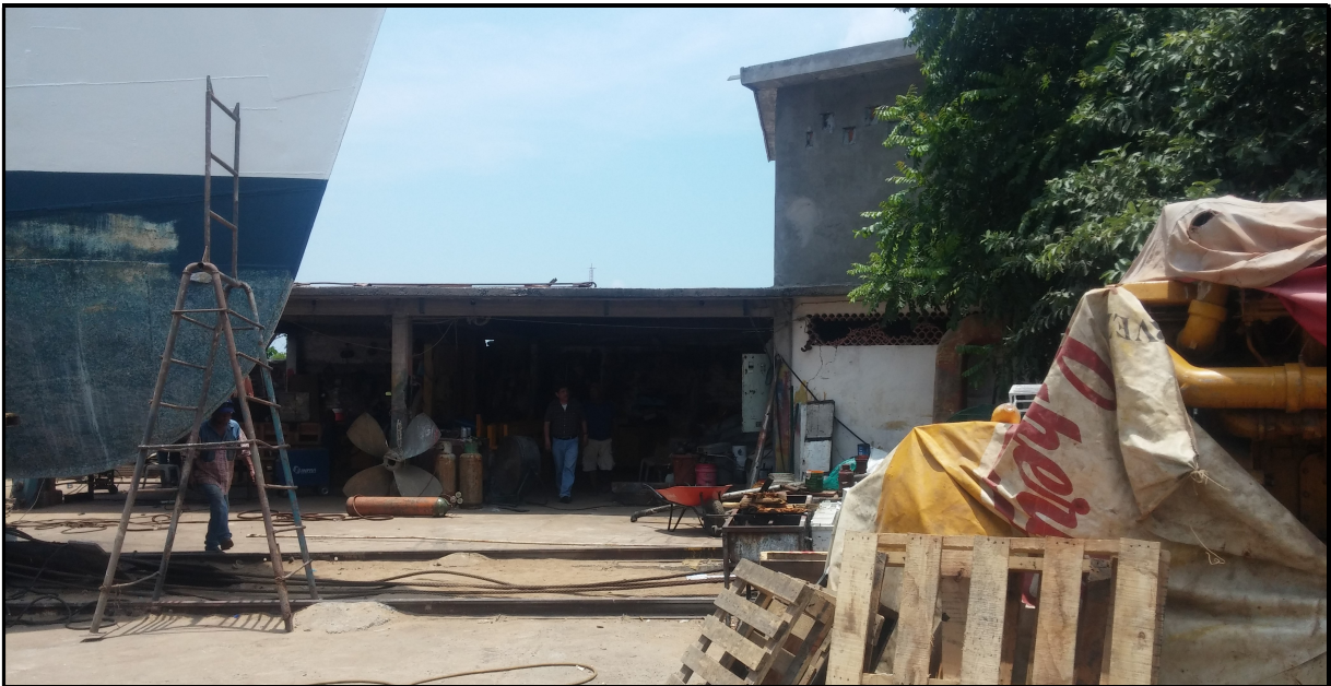
IMAGEN 80: VISTA GENERAL.