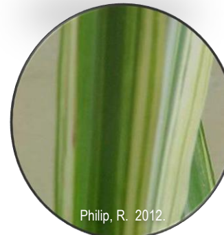
Xanthomonas axonopodis pv. vascularum Gomosis de la caña de azúcar