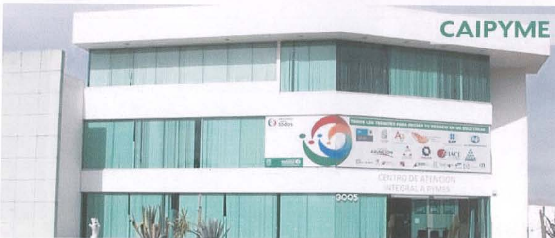
Centro de Atención Integral a la Micro, Pequeña y Mediana Empresa del Estado de Aguascalientes

El Centro de Atención Integral a la Micro, Pequeña y Mediana empresa del Estado de Aguascalientes se encuentra ubicado en Blvd. José María Chávez No. 3005, en la Colonia San Pedro.