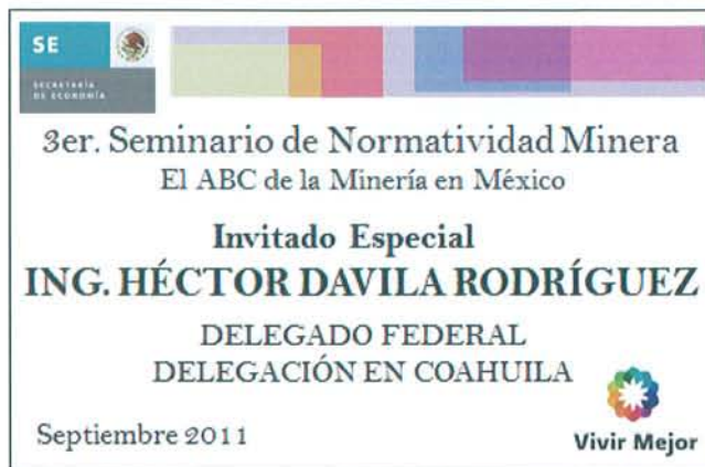
Figura 21: Gafete para los invitados especiales