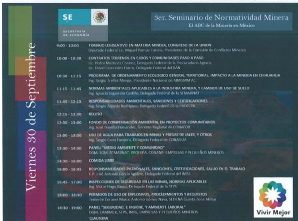
Figura 11: Programa