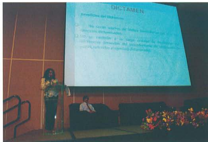
Figura 18: Conferencia