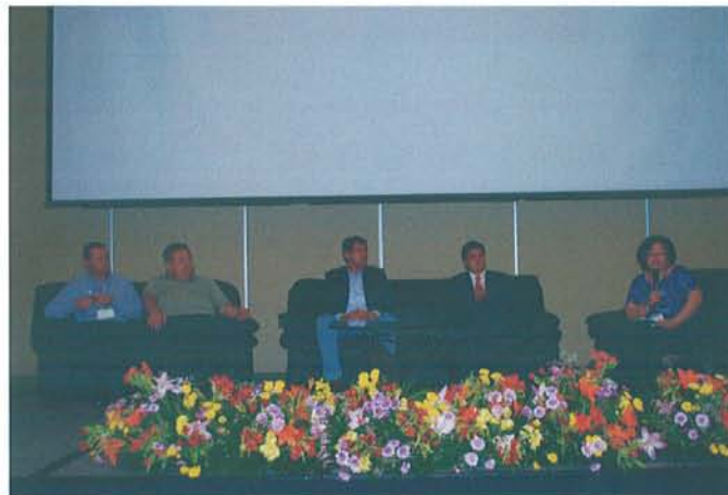
Figura 17: Panel sobre Áreas naturales protegidas