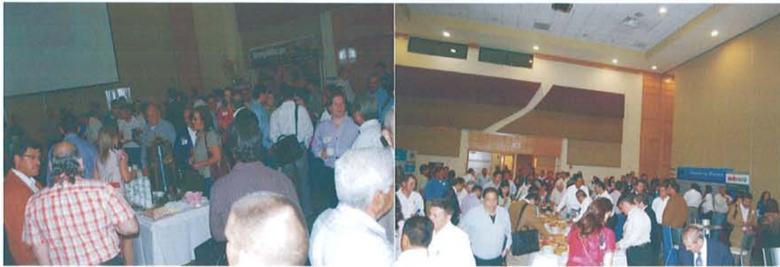
Figura 16: Coffe break