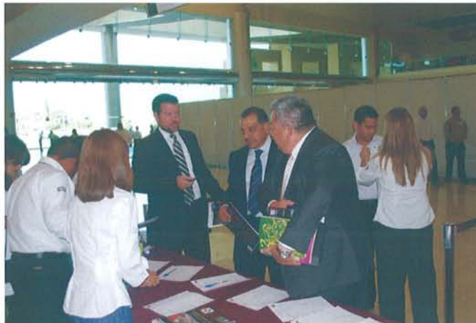
Figura 12: Registro de los asistentes

Esta edición permitió a la Secretaría de Economía -mediante la Dirección General de Minas- exponer el marco legal de concesiones en México, sus obligaciones, así como el nuevo Reglamento de la Ley Minera; La Dirección de Comercio Exterior presentó las obligaciones que tienen las empresas que cuentan con inversión extranjera, los programas de fomento e incentivos para la Industria Manufacturera, Maquiladora y de servicio de Exportación (IMMEX), así como las facilidades del Fondo PyME. Adicionalmente, el Servicio Geológico Mexicano y el Fideicomiso de Fomento Minero presentaron sus respectivos programas de apoyo y servicios que brindan al sector minero.