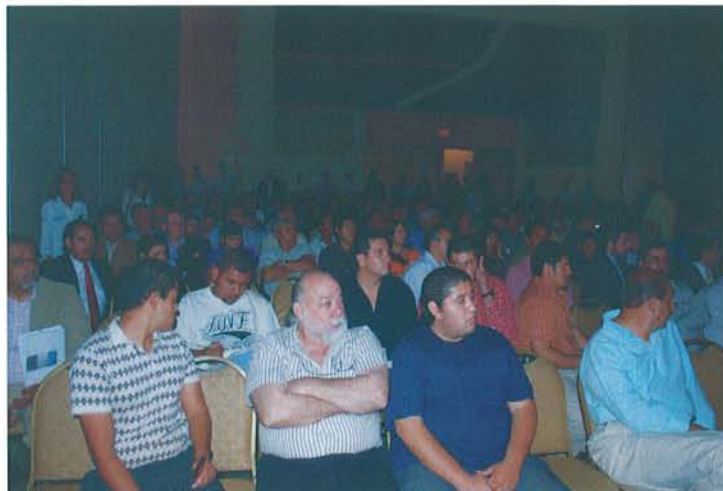
Figura 15: Asistentes al Seminario

En los paneles se trataron la problemática que enfrenta el sector en cuanto a las concesiones mineras, asuntos de cuidado del medio ambiente y la comunidad, así como la seguridad e higiene en el ambiente laboral.