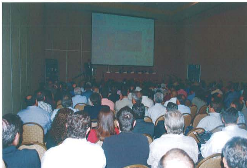
Figura 13: Ceremonia de inauguración