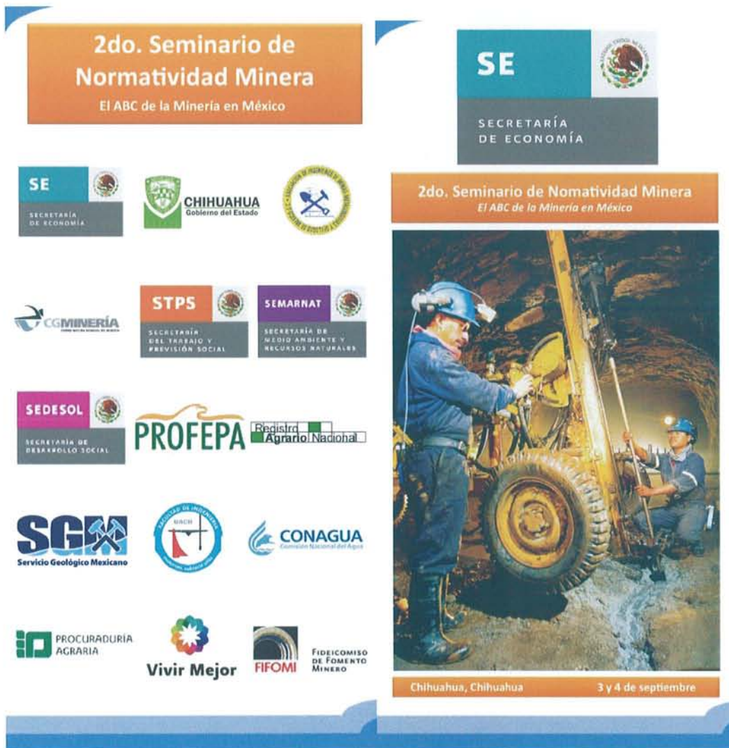
Figura 9: Lonas decorativas