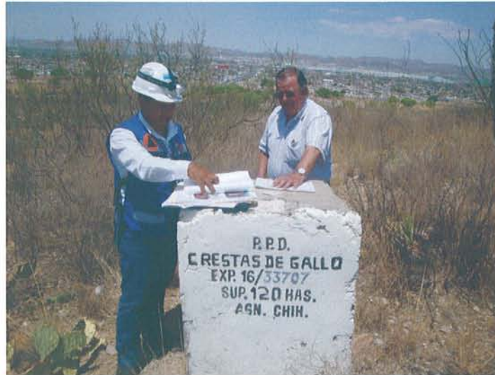
Figura 25: Ubicación del "Punto de Partida" o Mojonera

Se observó una disminución en los errores comunes de interpretación de la normatividad por parte de la ciudadanía al momento de presentar trámites sobre asuntos mineros en la Subdirección de Minas en la Delegación.