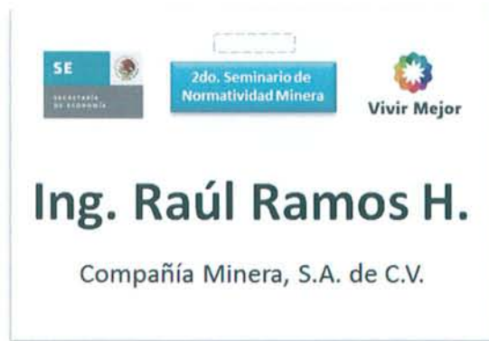
Figura 8: Gafete del asistente