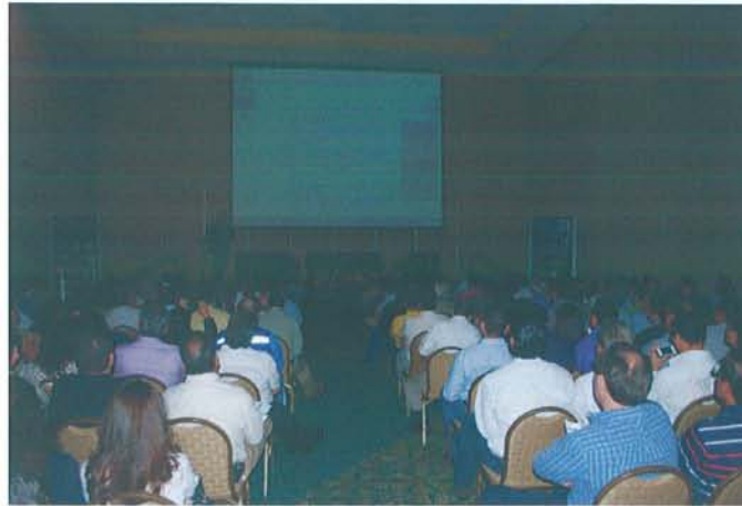
Figura 14: Conferencia

Además de las organizaciones invitadas a las ediciones anteriores, se agregó la participación de la Secretaría de la Defensa Nacional (SEDENA), la cual explicó los requisitos para solicitar los permisos de usos de explosivos, así como los procedimientos y las mejores prácticas para el manejo de los mismos. Por su parte, el Instituto Mexicano del Seguro Social (IMSS), en su participación detalló las responsabilidades patronales, sanciones y certificaciones en relación a la salud en el trabajo. Adicionalmente, el Servicio de Administración Tributaria (SAT), mostró los incentivos fiscales ofrecidos al sector minero y el procedimiento para solicitar la devolución del IVA.