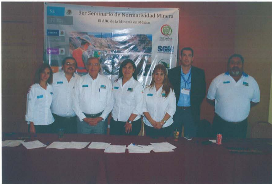
Figura 20: Algunos miembros del personal de la Delegación