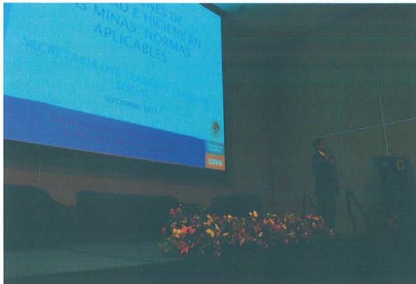
Figura 19: Conferencia