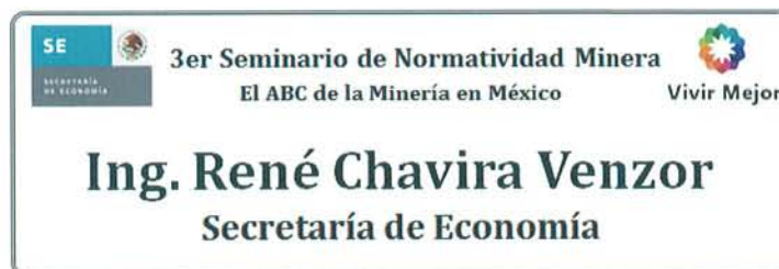
Figura 23: Identificador del Presídium