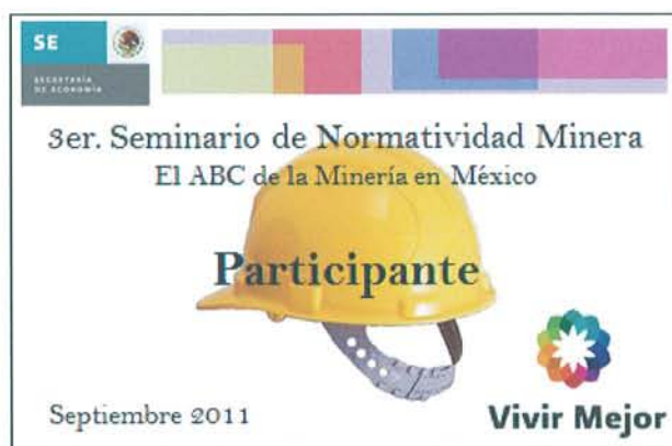
Figura 22: Gafete para los asistentes