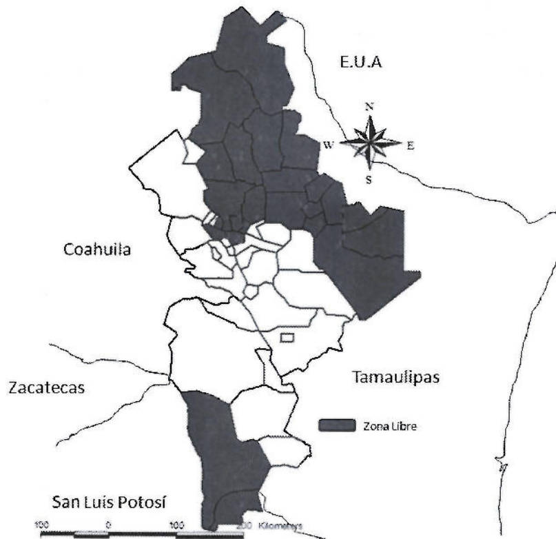
Distribución del trampeo en la Zona Libre de Moscas de la Fruta.

(*) Depende de la disponibilidad del fruto.