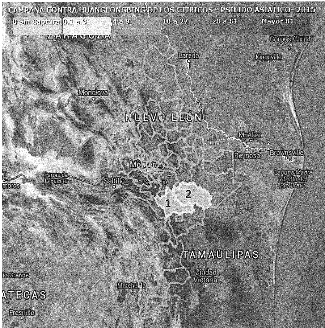
Figura 1. Mapa de la situación fitosanitaria que guarda la plaga en la Entidad (1.- Montemorelos, 2.- General Terán).

Mediante el monitoreo del psílido asiático de los cítricos realizado en las Áreas Regionales de Control (ARCOs) operadas durante el 2015 en el estado de Nuevo León, se logró conocer la fluctuación poblacional del insecto a través del año, para lo cual se tuvo un nivel de infestación anual de 0.07 psílicos/trampa y en el mes de diciembre de 0.02 psílicos/trampa. Además, permitió identificar huertas en donde hubo un incremento de la población del vector, en las cuales se realizó el control de dichos brotes en beneficio de toda la superficie bajo ARCOs (figura 1).