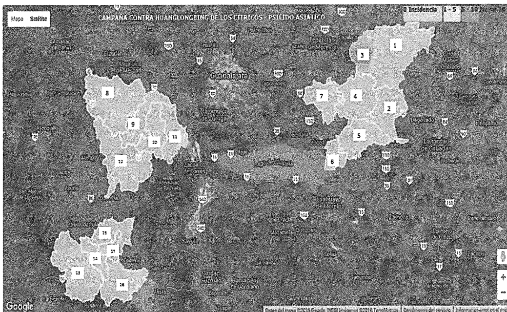
Figura 1. Mapa de la situación fitosanitaria que guarda la plaga (1.- Arandas, 2.- Ayotlán, 3.- San Ignacio Cerro Gordo, 4.- Atotonilco El Alto, 5.- La Barca, 6.- Jamay, 7.- Tototlán, 8.- Ameca, 9.- San Martín Hidalgo, 10.- Cocula, 11.- Villa Corona, 12.- Tecolotlán, 13.- Autlán de Navarro, 14.- El Grullo, 15.- Ejutla, 16.- Tuxcacuesco, 17.- El Limón.

Mediante el monitoreo del psílido asiático de los cítricos realizado en las Áreas Regionales de Control (ARCOs) operadas durante el 2015 en el estado de Jalisco, se logró conocer la fluctuación poblacional del insecto a través del año, para lo cual se tuvo un nivel de infestación anual de 0.2 psílicos/trampa y en el mes de diciembre de 0.1 psílicos/trampa. Además, permitió identificar huertas en donde hubo un incremento de la población del vector, en las cuales se realizó el control de dichos brotes en beneficio de toda la superficie bajo ARCOs, por parte de productores (figura 1).